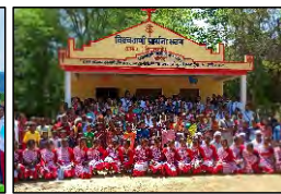
18 KAMDA, JHARKHAND - 21.05.23