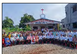
45 RUNDIYA, GUJARAT - 25.09.23