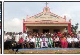
30 PALIYAKHEDA, RAJASTHAN - 02.07.23