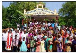
21 CHINATHOLUMANDA, A.P. - 28.05.23