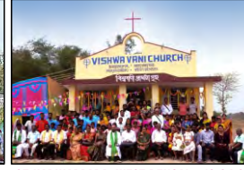
05 HARIHARPARA, WEST BENGAL - 16.04.23