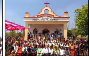
06 SHEPUAMPA, GUJARAT - 16.04.23