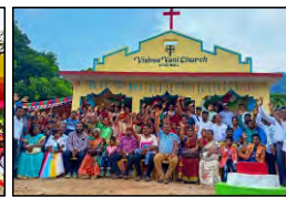
17 KIDRIMAL, ODISHA - 21.05.23