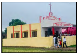
32 MAHAL TALWANDI, PUNJAB - 09.07.23