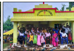
34 GENTUBEDA, ODISHA - 22.07.23