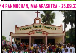
50 BURRATHOGU, A.P. - 16.10.23