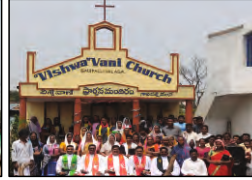
83 GADIPALLIVALASA, A.P. - 30.03.2024