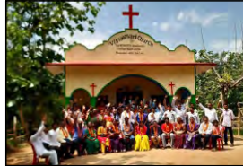
10 KHUNTIATOLA, ODISHA - 30.04.23