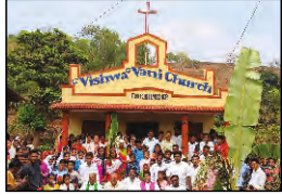
80 DOKRIPODOR, ODISHA - 24.03.2024