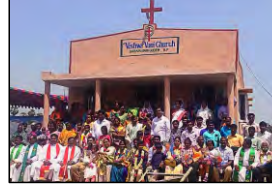
01 SURAPUVARIGUDEM, A.P. - 10.04.23

இந்நான்கு பக்கங்களில் புகைப்படங்களாக இடம்பெறும் 85 ஆலயங்களுக்கும் அதன்முன் கூடிநிற்கும் முதல் தலைமுறை விசுவாசிகளும் உங்கள் இருதயங்களைக் கிறிஸ்துவுக்குள் பூரிப்பாக்கட்டும்; இவ்வாலயங்கள் எழும்பத் தேவன் பயன்படுத்திய விசுவாசக் குடும்பங்களைப் பெரும் நன்மைகள் நிரப்பட்டும்; இன்றும் 129 பணித்தளங்களில் இடம்பெறும் ஆலயக் கட்டுமானப்பணிகளை நிறைவுசெய்வதில் உங்கள் உளமார்ந்த ஜெபங்களும், உதாரத்துவமான ஈகைகளும் பெரும்பங்கு வகிக்கட்டும்; பாரத பணித்தளங்களில் பெருகும் ஆத்துமாக்கள் - ஆலயங்கள் மூலம் அறுவடையின் எஜமானருக்கு மேலும் மேலும் ஸ்தோத்திரங்கள், துதிகள், கனம், கீர்த்தி, புகழ் பெருகட்டும்!