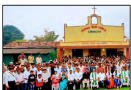
44 RANMOCHAN, MAHARASHTRA - 25.09.23