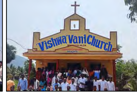
02 VENKAYPALEM, A.P. - 12.04.23