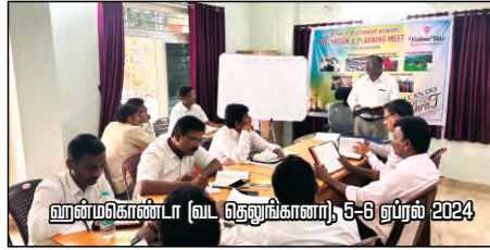
ஹைம்கொண்டா (வட தெலுங்கானா), 5-6 ஏப்ரல் 2024