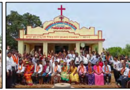
23 LARIBADI, ODISHA - 06.06.23