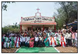
26 KOTHABAGGAM, A.P. - 11.06.2023