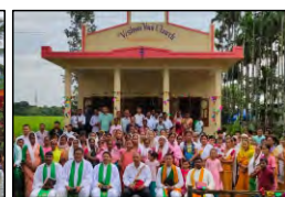
41 FERSUABARI, ASSAM - 24.09.23