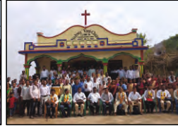
77 ELUMETA, ODISHA - 23.03.24