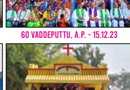
66 SCHOOLSAAHI, ODISHA - 15.01.2024