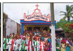
40 VANDUVA, A.P. - 17.09.23