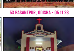
59 BUSAYAVALASA, A.P. - 12.12.23