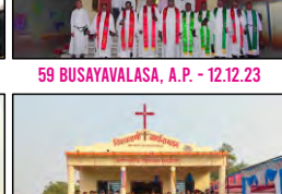
65 PATHARIYA, CHHATTISGARH - 28.12.23