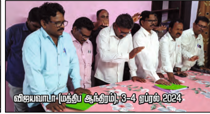
விஜயவாடா (மத்திய ஆந்திரம்), 3-4 ஏப்ரல் 2024