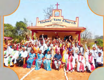
Y.SRIRAMAPURAM, A.P. - 24.03.2024