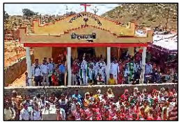
20 BIRTA, JHARKHAND - 28.05.23