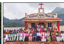
48 PANDRIVALASA, A.P. - 01.10.23