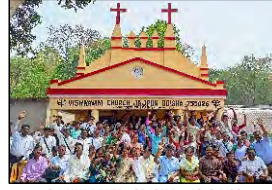
04 KULAPITA, ODISHA - 16.04.23