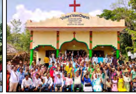
08 RASIKARAJPUR, ODISHA - 28.04.23