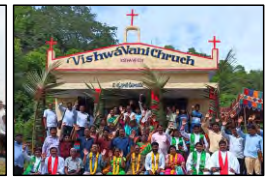
31 KOTHAVEEDI, A.P. - 08.07.23