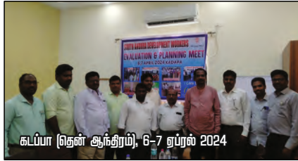
கடப்பா (தென் ஆந்திரம்), 6-7 ஏப்ரல் 2024