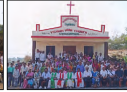
78 SAINDANIPADA, MAHARASHTRA - 23.03.24