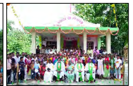
37 LATAPOTA, WEST BENGAL - 15.08.23