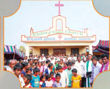
PONUGODU, TELANGANA - 20.03.2024