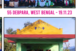
61 BEENA, HIMACHAL PRADESH - 17.12.23