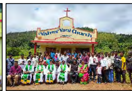
35 KUTHANGI, ANDHRA PRADESH - 25.07.23