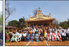
79 Y.SHRAMAPURAM, A.P. - 24.03.24