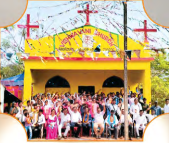
BAGHUAPAL, ODISHA - 15.03.2024

கண்ணீரோடே விதைக்கிறவர்களுக்குக் களங்கள்தோறும் கெம்பீர அறுவடை உண்டு; விளையச்செய்கிற தேவனாலேயே உண்டு, அல்லேலூயா!