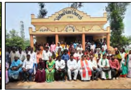
22 ITIKA, ANDHRA PRADESH - 04.06.2023