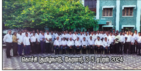
கொச்சி (தமிழ்நாடு, கேரளா), 3-5 ஏப்ரல் 2024