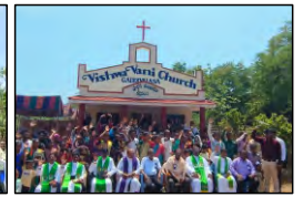
25 GADIVALASA, A.P. - 11.06.2023