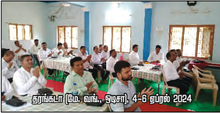
தூங்கடா (மே. வங்., ஒடிசா), 4-6 ஏப்ரல் 2024