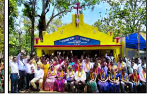
09 PATARAPADA, ODISHA - 29.04.23