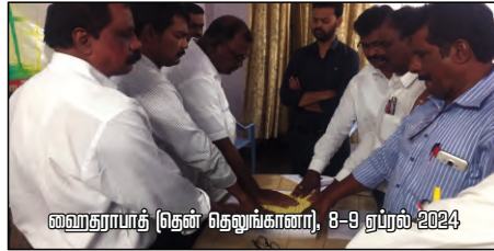
ஹைதராபாத் (தென் தெலுங்கானா), 8-9 ஏப்ரல் 2024