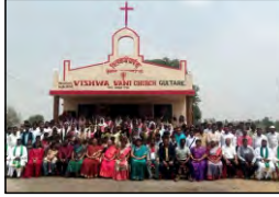
82 GULTARE, MAHARASHTRA - 30.03.24