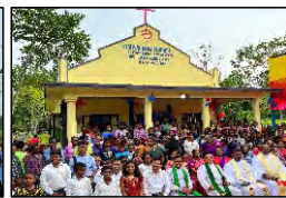
16 FACTORY LINE, W. BENGAL - 21.05.23