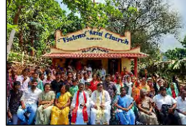
07 BONDURU, A.P. - 23.04.23