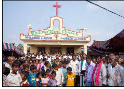
76 PONUGODU, TELANGANA - 20.03.2024