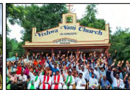
36 SALIDANGUDA, A.P. - 30.07.2023