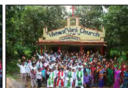
47 S. SIVARAMPURAM, A.P. - 01.10.23