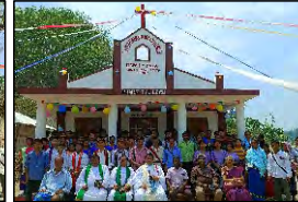
12 DUSPAIHA PARA, TRIPURA - 06.05.23