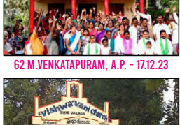
68 GODEVALASA, A.P. - 27.01.24