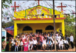
74 BAGHUAPAL, ODISHA - 15.03.2024