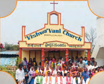
GADIPALLIVALASA, A.P. - 30.03.2024