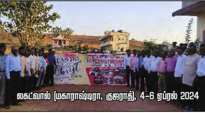
சகட்வால் (மகாராஷ்டிரா, குஜராத்), 4-6 ஏப்ரல் 2024