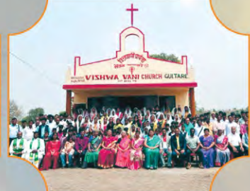
GULTARE, MAHARASHTRA - 30.03.24