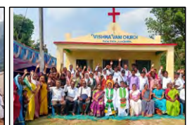
49 BADAPADA, ODISHA - 15.10.23