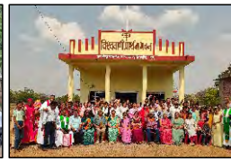
28 SEMARIYA, CHHATTISGARH - 17.06.2023