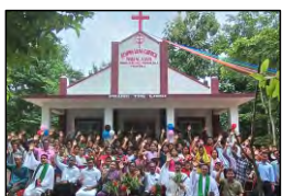
38 WARENG KAMI, TRIPURA - 03.09.23