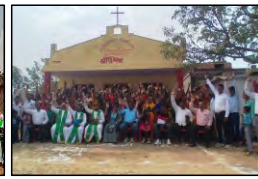
29 PANDEYPUR, U. P. - 25.06.2023