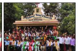
43 IPPAMANUGUDA, A.P. - 24.09.23