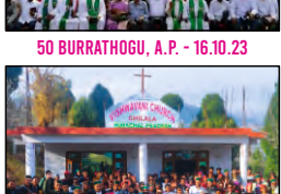
56 CHILALA, HIMACHAL PRADESH - 25.11.23