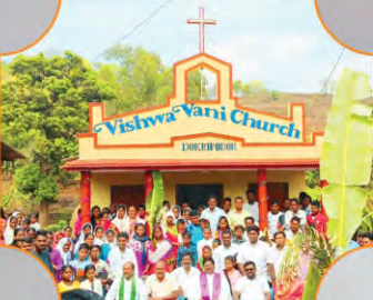
DOKRIPODUR, ODISHA - 24.03.2024