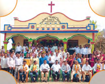
ELUMETA, ODISHA - 23.03.2024