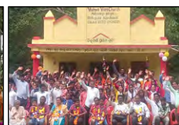
42 MAHASINGI, ODISHA - 24.09.23