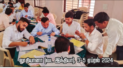
லூதியாணா (வட இந்தியா), 3-5 ஏப்ரல் 2024

முன்வரும் ஆறு மாத ஊழியங்களுக்கான திட்டக் கூடுகைகள் 2024