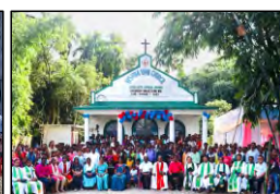
46 SINGJIHORA, WEST BENGAL - 01.10.23