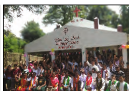
39 MANIKRAI PARA, TRIPURA - 09.09.23