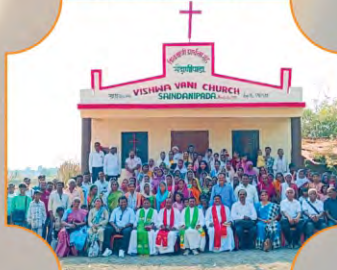
SAINDANIPADA, MAHARASHTRA - 23.03.2024