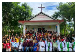
33 CHIROLINE, WEST BENGAL - 16.07.23