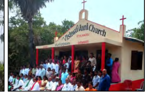
03 VUYALAMADUGU, A.P. - 14.04.23