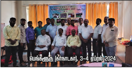
பெங்களூரு (கர்நாடகா), 3-4 ஏப்ரல் 2024