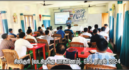
சீலிகுரி (வடகிழக்கு மாகாணம்), 6-8 ஏப்ரல் 2024