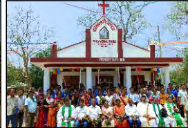
11 MANASING PARA, TRIPURA - 30.04.23