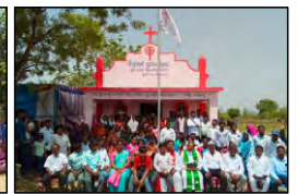
19 TARABHA, ODISHA - 27.05.23