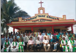
81 NAGAMMAGUDA, A.P. - 24.03.2024