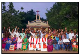
14 CHINNA KONANGI, A.P. - 10.05.23