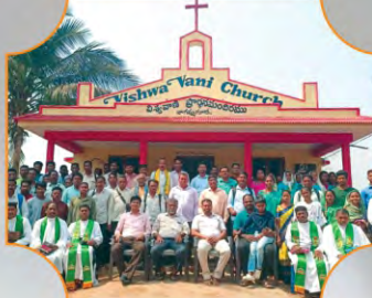
NAGAMMAGUDA, A.P. - 24.03.2024